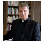
ミカエル・カルマノ